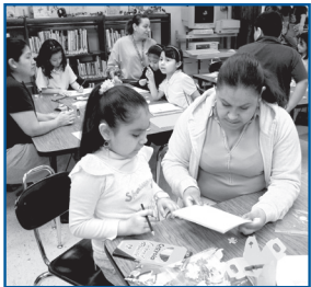
Participantes en la publicación de libros de la Escuela McKinley.

La Escuela Roosevelt se ha dedicado a fortalecer las relaciones entre el hogar y la escuela. Algunos de los eventos familiares que se llevaron a cabo son: El mes de la herencia hispana en octubre, con música y comida de diferentes países; noches de currículo escolar; una presentación festiva en diciembre; y el primer baile familiar en febrero. También se invita a las familias a celebrar el final del curso escolar presenciando el programa de talentos (Talent Show) de la Escuela Roosevelt, el 18 de mayo.