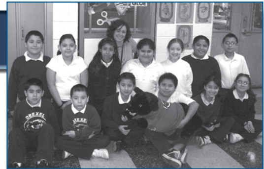
Estudiantes de la Escuela Drexel del salón 307 ganaron a Drex, la pantera de la escuela, por dos semanas.

Los salones de la Escuela Drexel pueden ganar la oportunidad de tener en su salón a Drex, la mascota de la escuela (una pantera de peluche), por dos semanas. Los salones pueden lograr esto de varias maneras, tal como tener asistencia perfecta o ser los primeros en cumplir con un trabajo. Cuando los alumnos reciben a Drex, se les da una golosina especial.