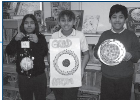
Varios alumnos de Columbus East exhiben sus proyectos de ciencias.

¡Los alumnos y maestros de Cícero West están leyendo todos los días preparándose para la visita de su superhéroe: Super Reader del planeta Lexicón! Super Reader visita la escuela dos veces por año para promover la lectura. Super Reader es parte del programa RIF ( La lectura es fundamental ) en el cual se da la oportunidad a todos los alumnos del distrito a elegir un libro tres veces al año el cual pueden llevar a casa y conservar. La corporación Nicor patrocina el programa RIF de Cícero West.